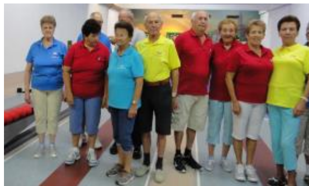
Kegler/innen in Teamarbeit in Rovinj

Die üblichen Stornobedingungen wie bei üblichen Reisebüros sind einzuhalten.