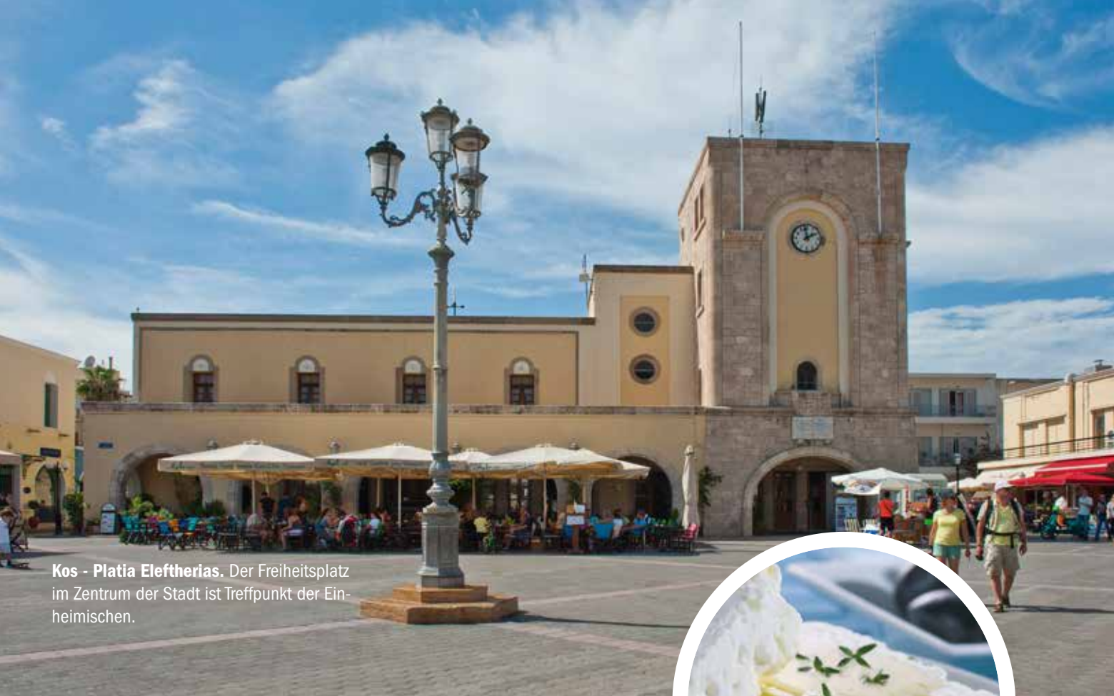
Kos - Platia Eleftherias. Der Freiheitsplatz im Zentrum der Stadt ist Treffpunkt der Einheimischen.